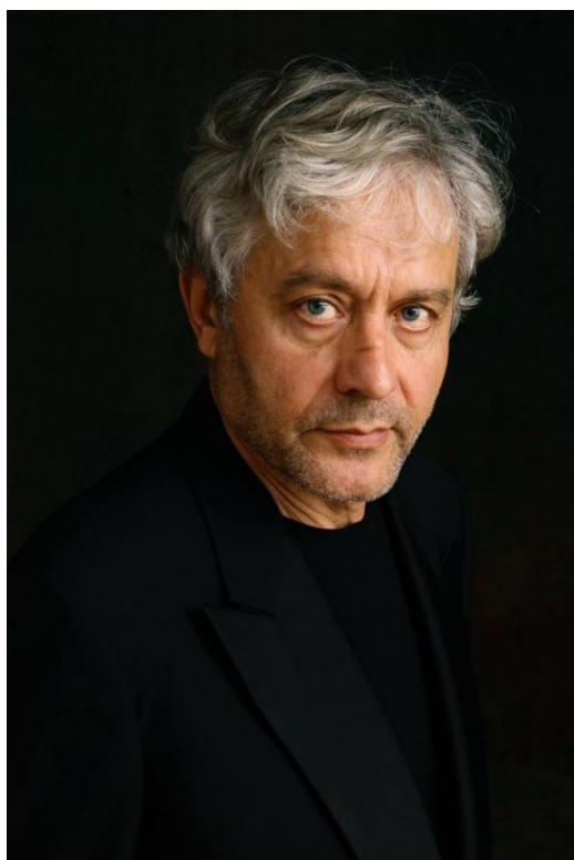
Didier Sandre

Poursuivant sa programmation « Mon Balzac », le musée a proposé à l'acteur Didier Sandre le jeu de la carte blanche à travers l'immensité de La Comédie humaine .