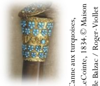
Canne aux turquoises, LeComte, 1834.