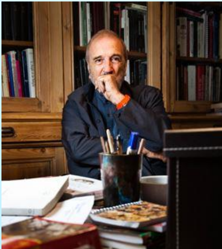
Jean-Claude Carrière

Selon Jean-Claude Carrière, « Balzac est le plus grand scénariste de l'histoire du cinéma ». Écrivain, scénariste, dramaturge, metteur en scène et parfois acteur au cinéma, Jean-Claude Carrière a travaillé avec les plus grands réalisateurs. Avec Balzac, il entretient une relation toute particulière qui repose sur le plaisir et l'intérêt.